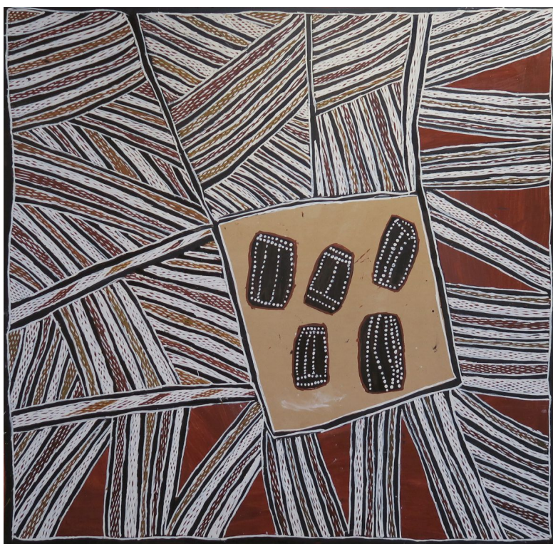
Nonggirnga Marawili, Water and Rocks I , 2016. Pigments naturels sur carton recyclé. 122x122 cm. Région d'origine : est de l'Arnhemland (Baniyala)

18 AVRIL - 30 AOÛT 2026 | MUSÉE DE LODÈVE