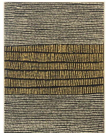
Artistes de Papunya Tula, Same Stories, A New Way , 2009. Gravures sur papier chiffon. Région d'origine : Kiwirrkura (Kintore)

Il est essentiel de reconnaître cette diversité, car les artistes de cette exposition appartiennent à des groupes linguistiques et des identités claniques spécifiques tels que les Pintupi, Pitjantjatjara, Warlpiri, Gija ou Yolngu, chacun avec son propre héritage créatif et ses responsabilités envers son Country .